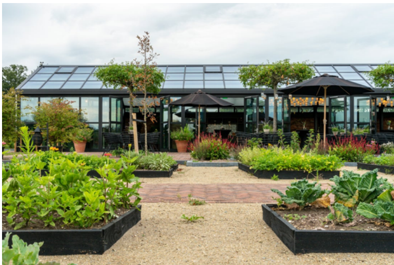
De hoteltuin in Apeldoorn

Verder bevindt zich in de tuin ook nog een moestuin. Deze moestuin is zo ingericht dat hij volledig toegankelijk is, ook voor rolstoelgebruikers. Veel van de groenten, kruiden en zelfs eetbare bloemen die in de tuin groeien, worden gebruikt in de gerechten van het restaurant.