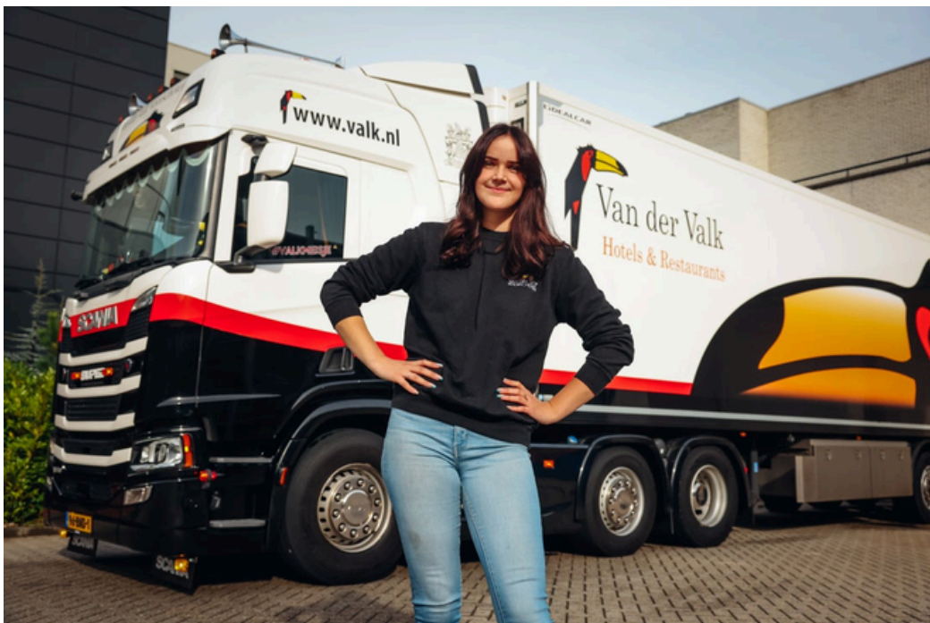
Een van onze chauffeurs, onderweg met een van onze vrachtwagens

Naast ons eigen logistieke transport spelen de bereikbaarheid en mobiliteit van onze gasten ook een belangrijke rol. Onze hotels zijn strategisch gelegen en ingericht op deze behoeften. Veel van onze hotels bevinden zich nabij belangrijke snelwegen en zijn goed bereikbaar met het openbaar vervoer. Samen met lokale en regionale vervoerders zorgen wij ervoor dat gasten die vanwege een beperking of uit duurzaamheidsoverwegingen met het openbaar vervoer reizen onze hotels makkelijk kunnen bereiken.