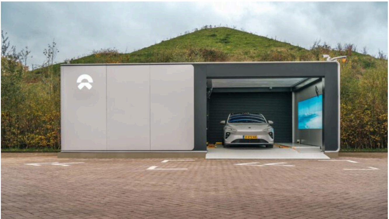
Power Swap Station Hotel Tilburg

Om bij te dragen aan deze ontwikkeling, zijn wij in 2022 een samenwerking met het bedrijf aangegaan. De eerste twee Power Swap Stations in Nederland zijn geplaatst op de terreinen van Hotel Tilburg en Hotel Apeldoorn. Inmiddels telt Nederland 10 van dit soort oplaadstations.